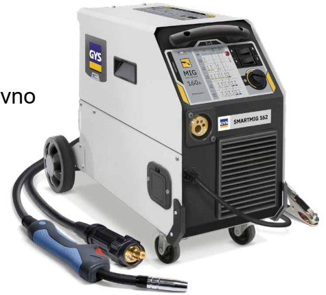
Priložena sta zemeljska sponka in 2m EURO svetilka.

Ventilator s stalnim delovanjem ščiti enoto pred pregrevanjem.